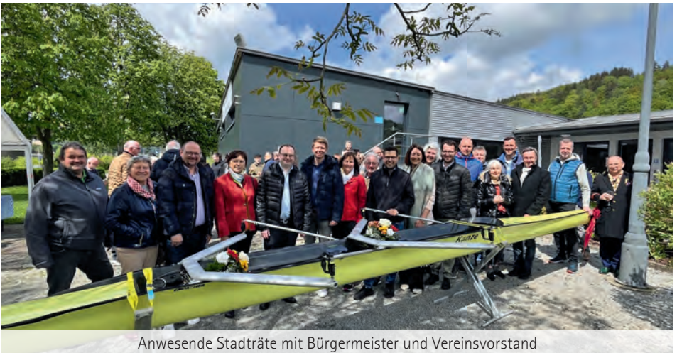
Anwesende Stadträte mit Bürgermeister und Vereinsvorstand